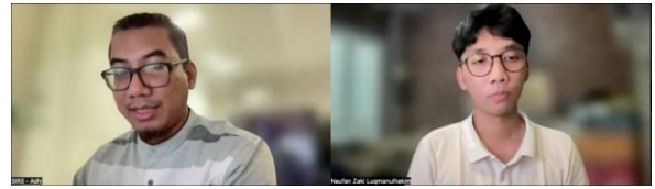
Gambar 2. Dokumentasi Diskusi dan Wawancara Manajemen Rumah Sakit Hasan Sadikin Kota Bandung